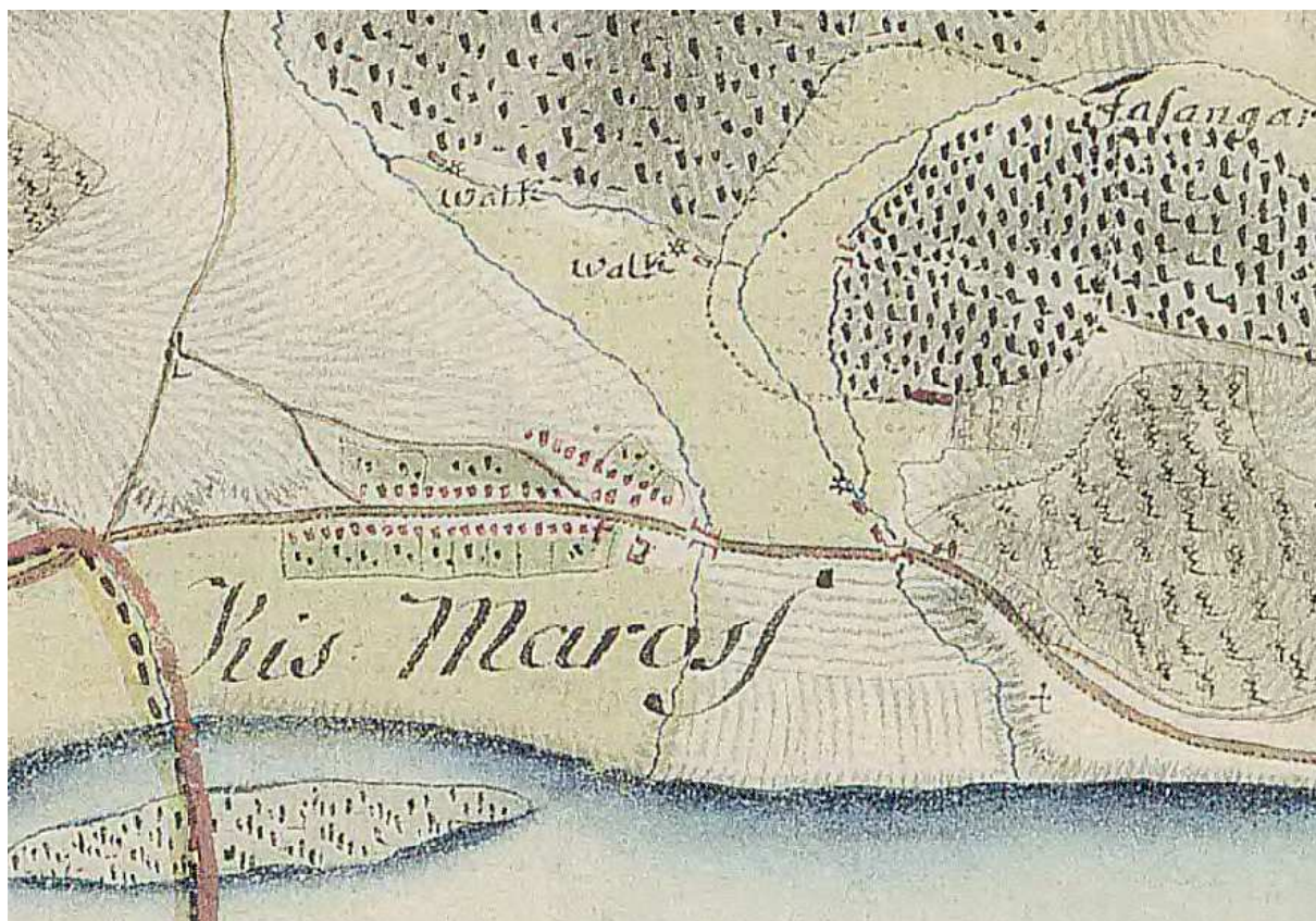
Kismaros, a Morgó-patak az első katonai felmérés térképén, az 1780-as években